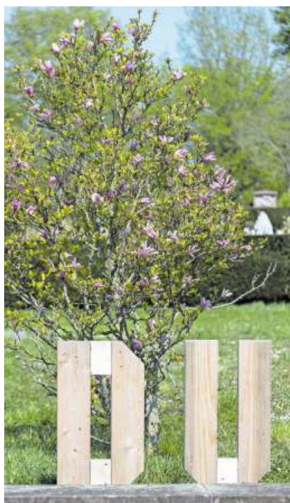
Die Wörter aus Tannenholz...