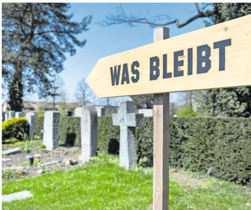
... nehmen jeweils Bezug auf ihre Umgebung...