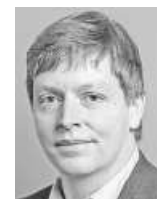
Lorenz Honegger lorenz.honegger @chmedia.ch

Trotzdem ist es entscheidend, dass die Schweiz den Schritt zurück in die Normalität auf keinen Fall überstürzt. Die Mehrheit der Bevölkerung ist nicht immun gegen das neue Coronavirus, ein Impfstoff fehlt. Eine zweite Ansteckungswelle ist damit eine reale Gefahr und wäre auch für die Wirtschaft verheerend. Der Bundesrat sollte deshalb den Bedürfnissen der Unternehmen weiterhin höchste Beachtung schenken, die Realität der Pandemie dabei aber nicht aus den Augen verlieren und sich bei der Lockerung der Eindämmungsmassnahmen an erfolgreichen Beispielen aus dem Ausland orientieren.