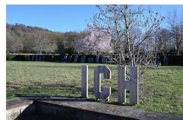
Wortbilder auf dem Friedhof am Hörnli